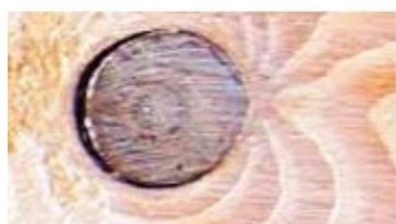
Présence de nœuds