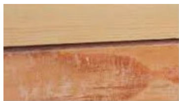
Fentes, gerces et fissures

Le bois est un matériau naturel, il peut présenter des imperfections. Un certain nombre d'entre elles sont normales et superficielles. Elles sont exclues du cadre de la garantie car elles n'influent en rien sur la résistance et la pérennité de votre piscine.