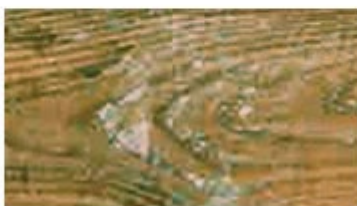
Rétention de produits d'étuve