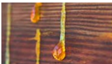
Remontées de résine